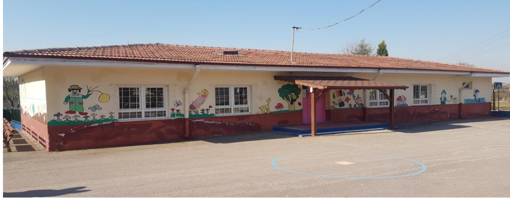
B- BLOK (1983)